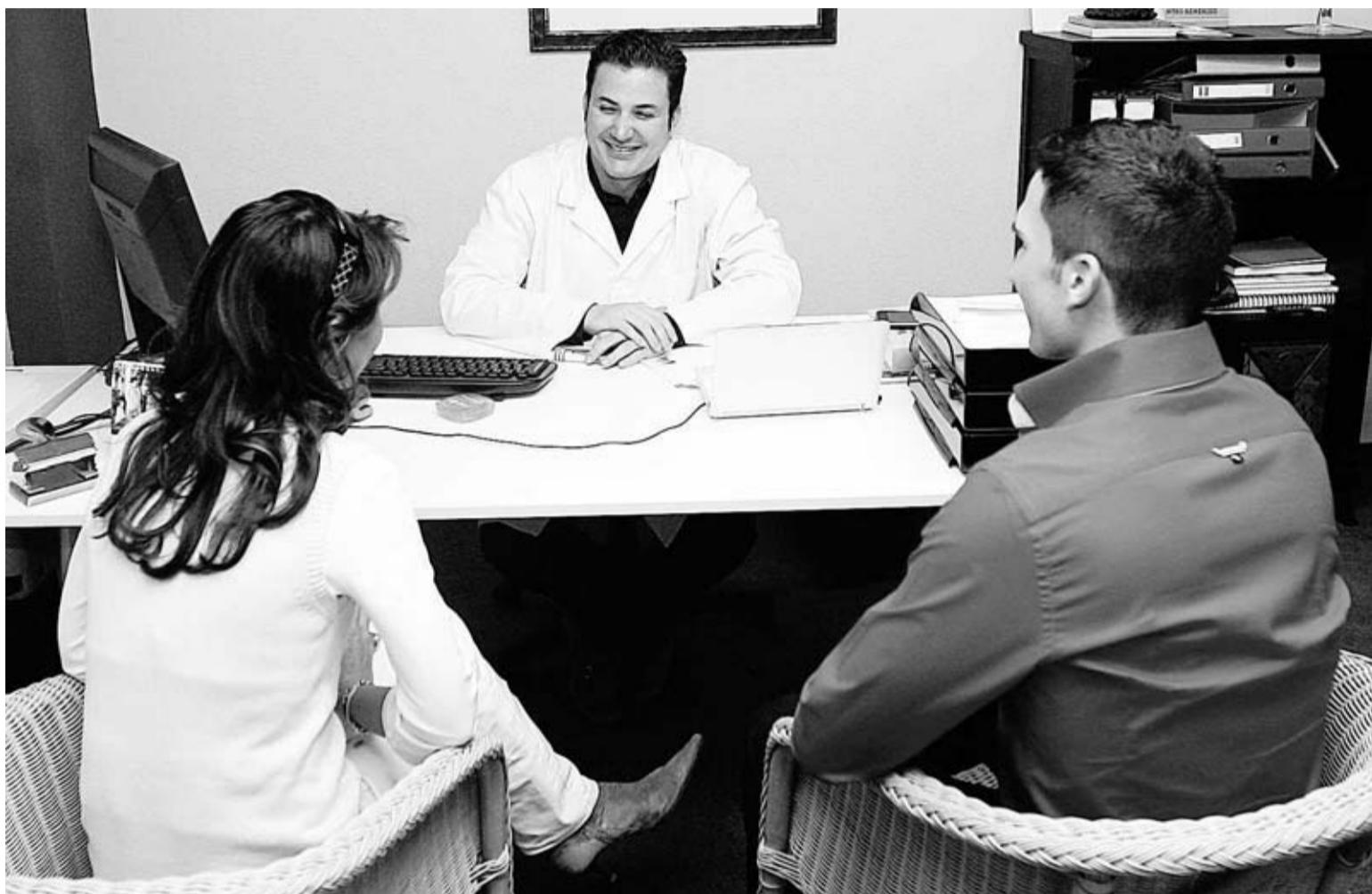
PROFESIONAL. La Clínica del Doctor Pérez Díaz atiende numerosos casos de estética con la garantía y seriedad requeridas.

-Reducir o hacer desaparecer las localizaciones de tejido adiposo.